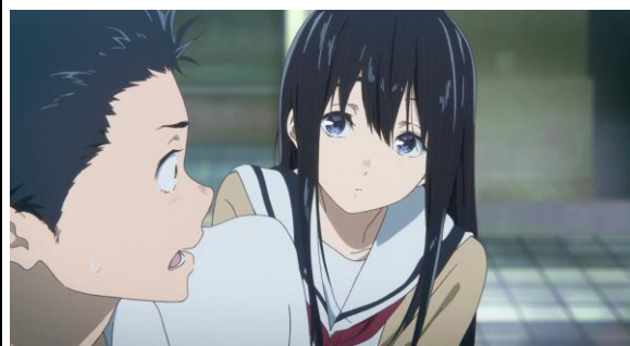
Photo du film Silent Voice