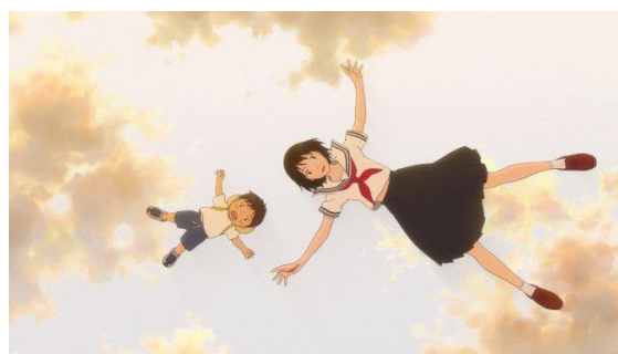
Photo du film Mirai ma petite sœur

Ensuite, c'est la sélection de Mirai ma petite sœur , de Mamoru Hosoda, dont nous avons passé plusieurs œuvres au cours de festivals précédents, film sur lequel les critiques ne tarissent pas d'éloges.