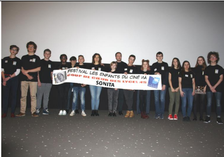
La proclamation du Coup de cœur

Le Jury des jeunes a choisi son Coup de cœur ce week-end : Sonita Cette action est soutenue par la Banque Populaire du Nord.